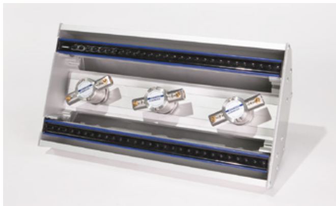
Version TC015 für die Reinigung von der Unterseite Version TC015 for cleaning of the bottom side

Hinweis: Technische Informationen s. Zubehör/Datenblatt Advice: Technical information s. Accessory/Datasheet